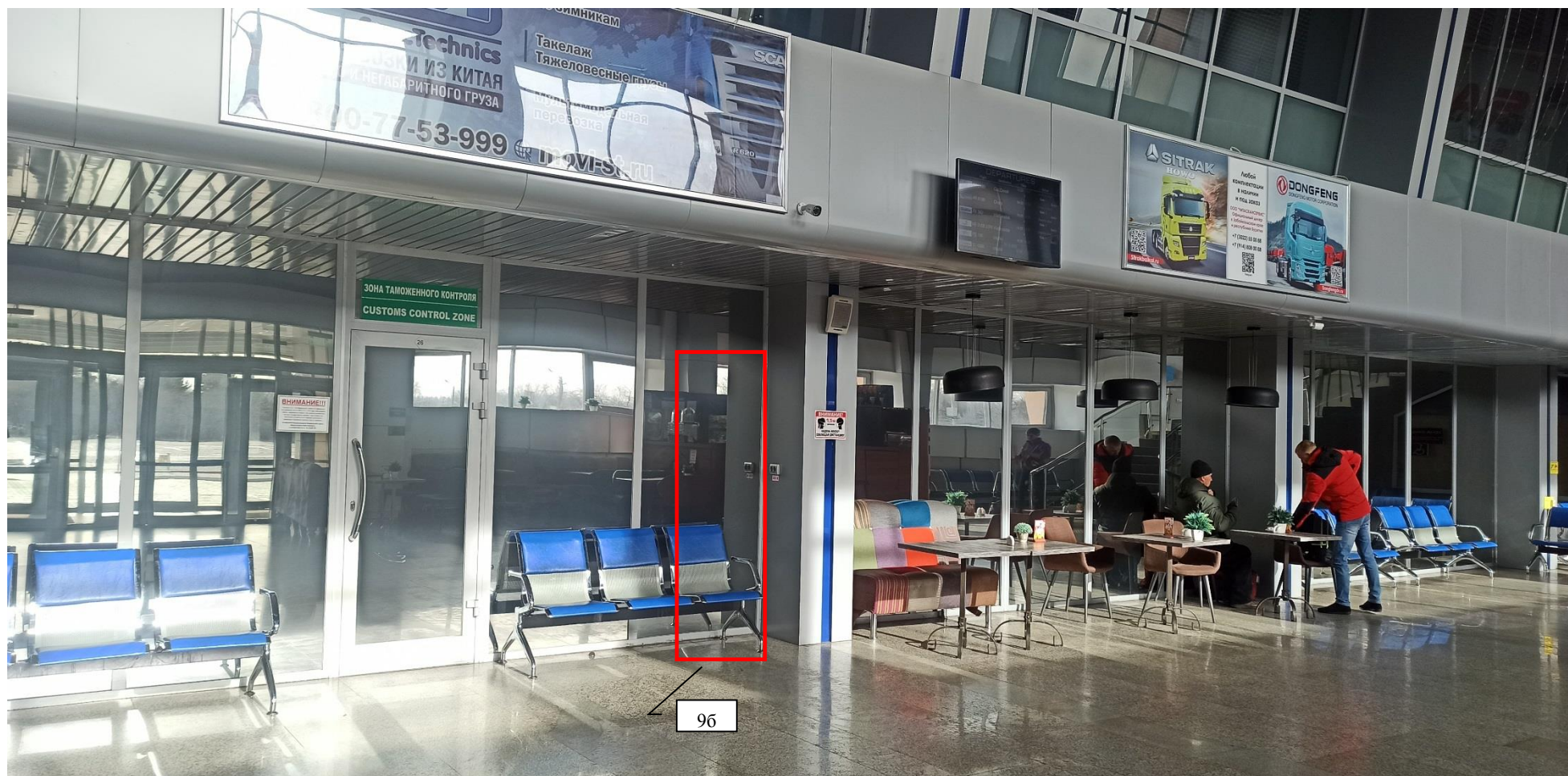
ФОТО РАЗМЕЩЕНИЯ КОММЕРЧЕСКОЙ ПЛОЩАДИ НА ПЕРВОМ ЭТАЖЕ ОПЕРАЦИОННАЯ ЗОНА АЭРОВОКЗАЛ ВНУТРЕННИХ ВОЗДУШНЫХ ЛИНИЙ